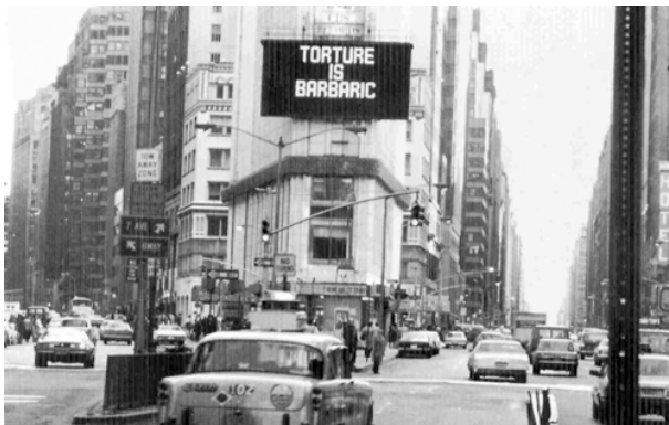
Martelen is barbaars