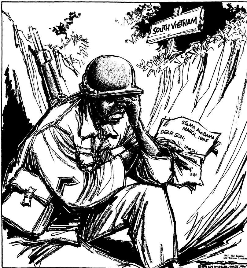
A LETTER FROM THE FRONT

Paul Conrad maakt naar aanleiding van gebeurtenissen op 7 maart 1965 in de Amerikaanse plaats Selma een prent voor de Los Angeles Times